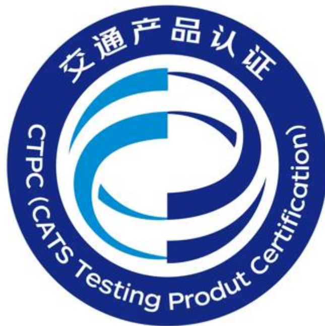
图 2 认证标志基本图案